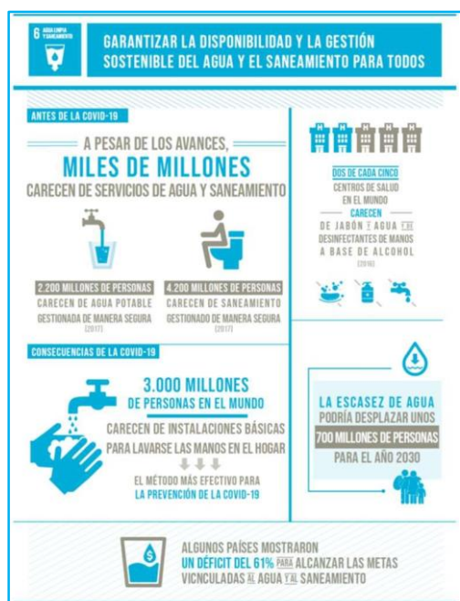
Figura 1 ODS N°6

En ese contexto, Naciones Unidas busca “Garantizar la disponibilidad y la gestión sostenible del agua y el saneamiento para todos” a través del Objetivo de Desarrollo Sostenible N°6. El Objetivo tiene metas que deben alcanzarse para 2030. El progreso hacia las metas se medirá mediante indicadores. 6